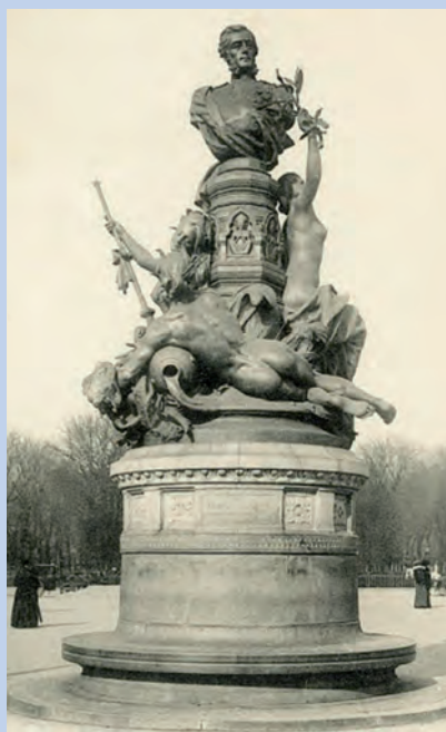
Monument Garnier à Paris

Au coucher du soleil comme aux matins glorieux, nous nous souviendrons d'eux.